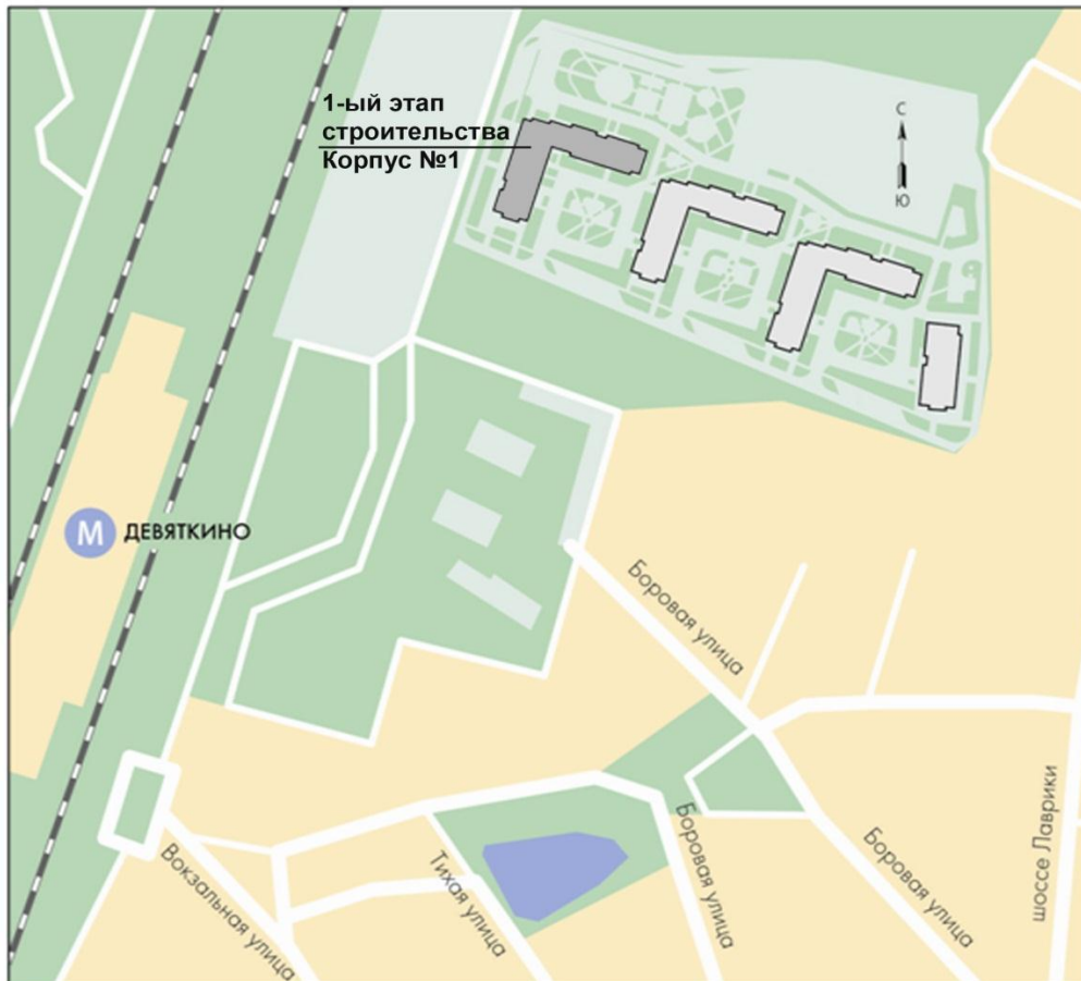
СХЕМА РАЗМЕЩЕНИЯ ОБЪЕКТА

Приложение №2 к Изменению №1 от 13.02.2012 года в Проектную декларацию от 17.08.2011 года, опубликованную в ежедневной газете «Невское время» №146(4888) от 20.08.2011 года многоэтажного жилого комплекса (1 этап строительства – многоэтажный жилой дом со встроенными помещениями – корпус №1) по адресу: Ленинградская область, Всеволожский район, земли САО ЗТ «Ручьи» от 13.02.2012г